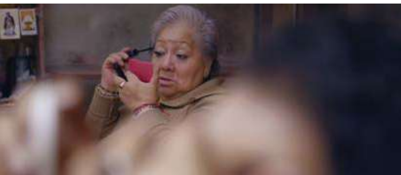
Seleccionada Abycine Lanza 2017

Violeta recibe la visita de Rita, la mujer de Jan, un amor de adolescencia que marcó su vida después de abandonarla. Violeta desconoce que la visita de Rita es el primer paso de Jan para intentar reescribir su historia. La película está protagonizada por Alex Brendemühl y Verónica Echegui.