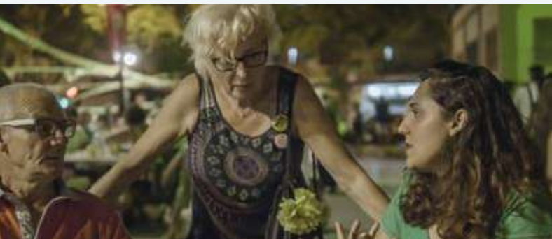
Seleccionada Abycine Lanza 2019