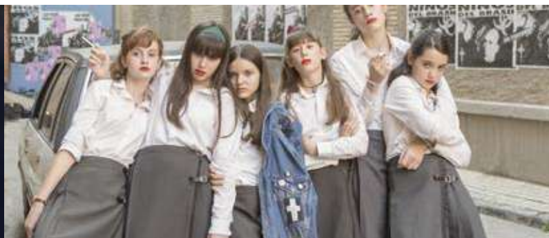
Seleccionada Abycine Lanza 2017

Doña Olga ha trabajado en el mundo del cabaret por más de 45 años y ahora es La Mami, la encargada del baño de mujeres del mítico Cabaret Barba Azul. Cada noche ofrece cuidado a las chicas que ahí trabajan bailando con los clientes. Para ellas, el baño es una burbuja de confianza dentro del Barba Azul. Hoy una nueva mujer llega al baño, tiene un hijo enfermo, necesita trabajo.